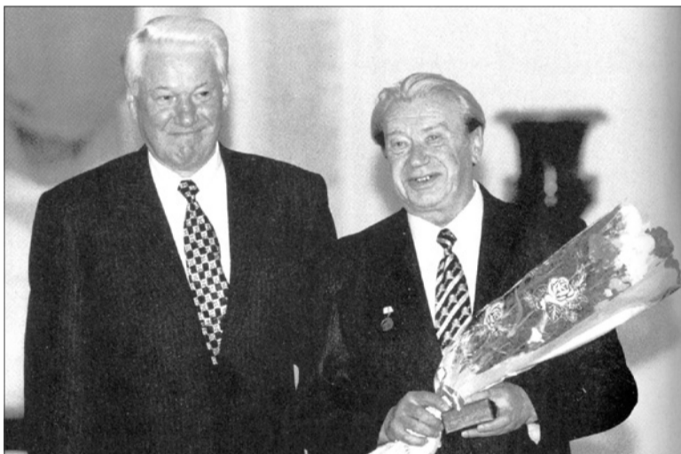
Е. И. Ухналев с Б. Н. Ельциным в Кремле на присвоении звания «Народный художник России». 1997 г.

Федор Колпаков Фото: из фондов ВМВЦ, из книги Е. И. Ухналева «Это мое»