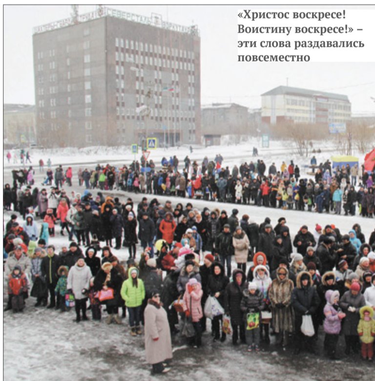
«Христос воскрес! Воистину воскрес!» – эти слова раздавались повсеместно