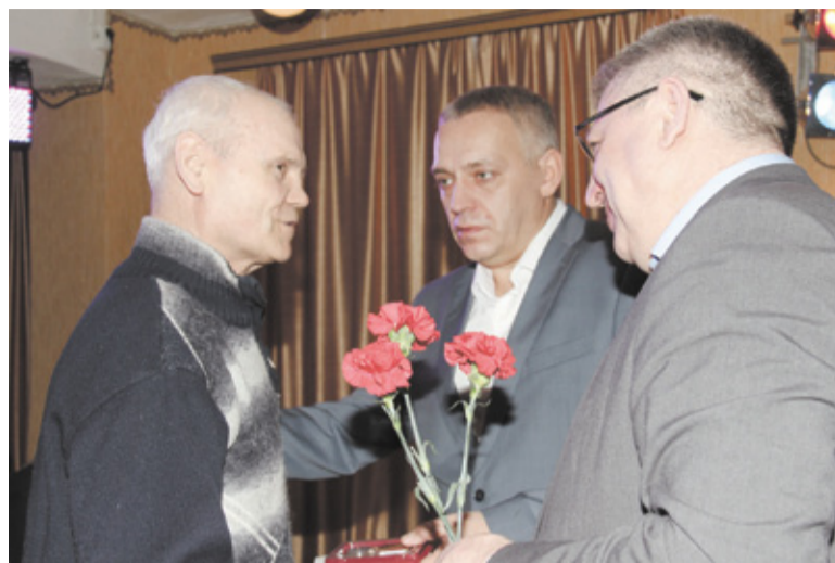
В торжественной обстановке руководители города вручили бывшим несовершеннолетним узникам медали, учрежденные президентом России к 70-летию Победы в Великой Отечественной войне 1941–1945 гг.

ку? Ни к чему это, – говорит бывший узник лагеря смерти.