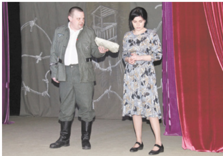
Центр национальных культур подготовил особую программу. Творческий коллектив показал зрителям театрализованное представление. На памятное мероприятие были приглашены школьники